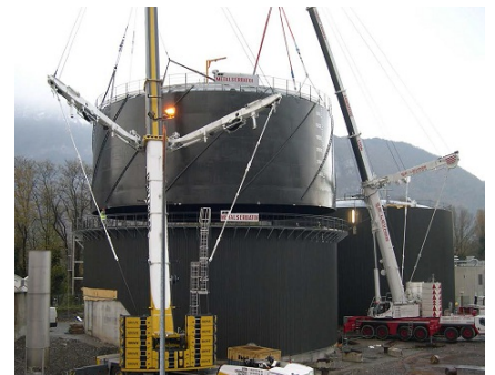
Pose de la cloche de stockage de biogaz sur le digesteur.

Le site du Groupe de Travail Injection : http://injectionbiomethane.fr