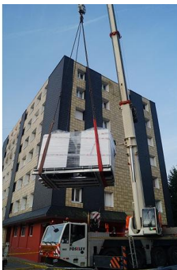
PAC à absorption gaz durant l'installation